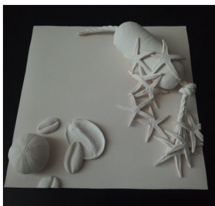
In Bed With La cellule , détail de l'installation, 2018, Céramiques, 30 x 20 cm et 30 x 15 cm