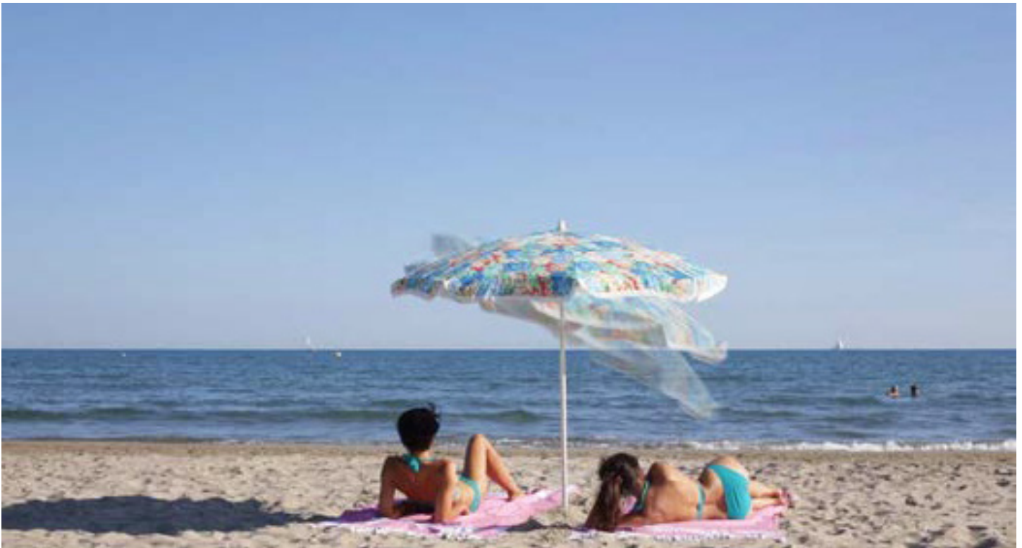
Ouh...she's a sexy girl ! Autoportrait à l'autoradio , 2016, vidéo et animation, 1 min et 19 secondes

Un parasol se met à chalouper sur le tube de l'été au son lointain d'un autoradio.