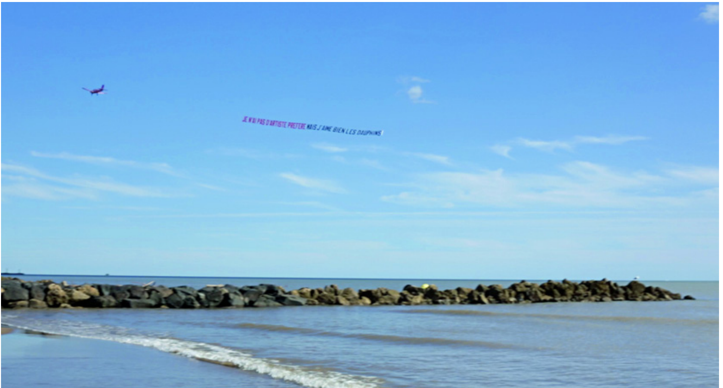
Je n'ai pas d'artiste préféré mais j'aime bien les dauphins, 2015, vidéo de performance, 23 secondes

Performance faisant passer un avion publicitaire déployant la banderolle "Je n'ai pas d'artiste préféré mais j'aime bien les dauphins" entre les plages de Vias et du Cap d'Adge.