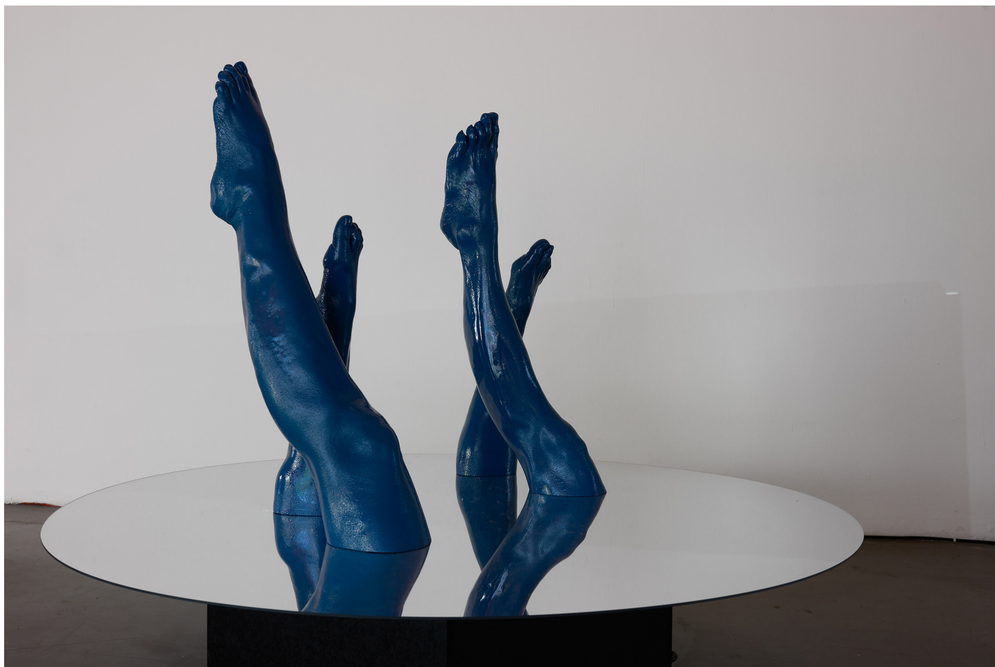
Autoportrait en natation synchronisée , 2016, résine, panneau en bois et miroir, 120 x 120 x 30 cm