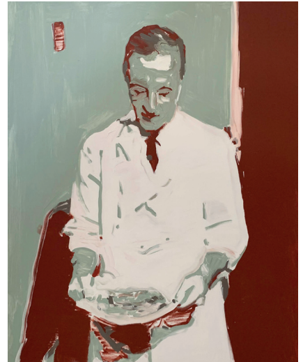
Linas Kaziulionis, Food Testing , 2022, acrylique sur toile, 100 x 80 cm