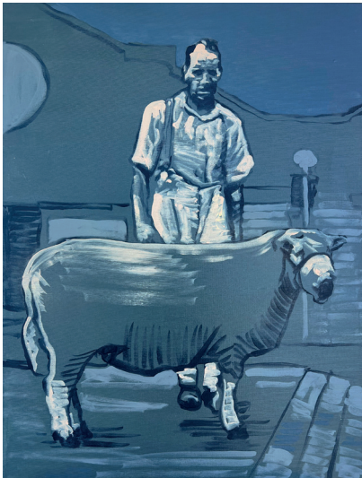
Linas Kaziulionis, Sheep , 2023, acrylique sur toile, 60 x 80 cm