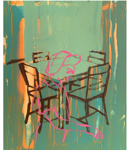
Linas Kaziulionis, 4 Chairs , 2023, acrylique sur toile, 60 x 50 cm