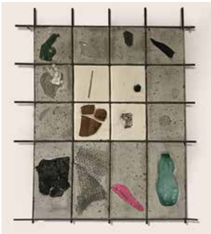
Morgane Porcheron, Damier De Trouvailles #4 , plâtre, béton, treillis métallique, éléments divers récupérés, 84 x 71 x 3 cm, Courtesy de l'Artiste