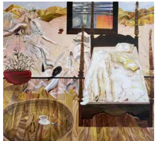
Lanee Hood-Hazelgrove, Act Three , 2023, acrylique sur toile, 168 x 178 cm, Courtesy de l'Artiste