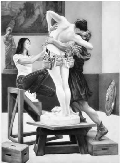
Maryline Terrier, Galatée et Pygmalion (d'après Jean-Léon Gérôme, Pygmalion et Galatée) , 2023, crayon graphite sur papier, 59 x 36 cm, encadrée: 70 x 50 cm