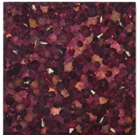
Florian Mermin, Minimal Odorant , 2022, pétales de roses rouges sur bois, 60 x 60 cm, Courtesy de l'Artiste et de Backslash