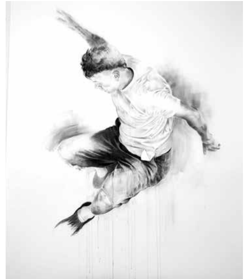
Violaine Desportes, Ravissement (Michael) , 2024, fusain sur papier, 200 x 150 cm