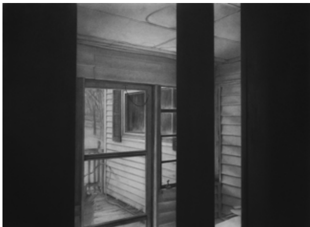
Reuben Negrón, Sans Titre (Echoes III) , 2021, fusain sur papier monté sur aluminium, 56 x 76 cm, Courtesy H Gallery, Paris