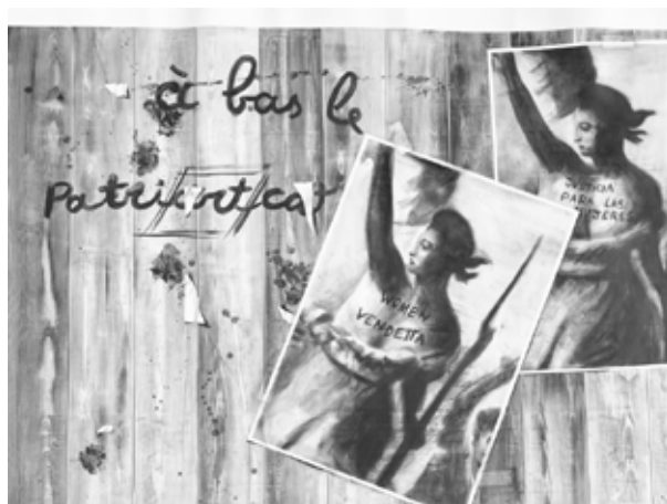
Jean-Philippe Roubaud, Barricade V (détail) , 2024, graphite sur papier, 134 x 900 cm