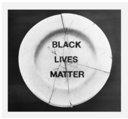
Jean-Philippe Roubaud, Black Lives Matter , 2020, graphite sur papier, œuvre encadrée, 30 x 30 cm