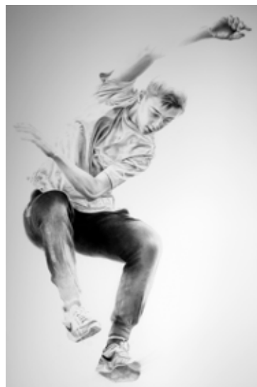
Violaine Desportes, Ravissement (Noa) , 2024, fusain sur papier, 152 x 200 cm