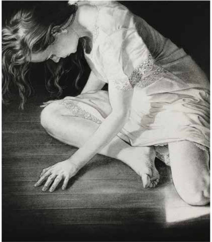
Reuben Negrón, These Small Remembrances , Série Marganne de Tai , 2018, fusain sur papier, 76 x 56 cm, Courtesy H Gallery, Paris ; Jean-Philippe Roubaud, Souvenir de brasse VI , Seine-et-Marne, 2024, dessin oxyde sur céramique et cadre, 4,5 x 30 cm

Le dessin, le noir et blanc font partie de l'ADN de H Gallery. La galerie a donc décidé de présenter une exposition qui rassemble des artistes qui travaillent quasiment uniquement le dessin noir et blanc, principalement au fusain et au crayon graphite, parfois sur des supports inattendus comme la céramique mais principalement sur papier.