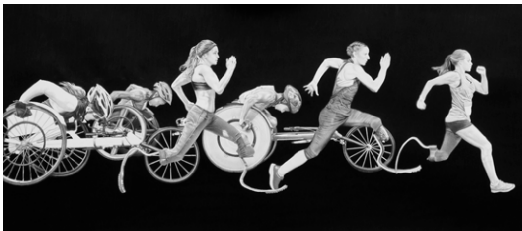
Maryline Terrier, Amazones paralympiques II , 2024, crayon graphite sur papier, 40 x 90 cm, encadrée : 50 x 100 cm, Courtesy H Gallery, Paris