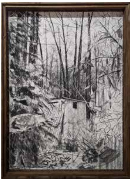
Louise Vendel, Terrain , 2023, fusain sur papier et grillage métallique, cadre en bois et brou de noix, 153 x 116 x 10 cm, Courtesy H Gallery, Paris

Inspirée par les ambiances nocturnes en ce qu'elles modifient notre rapport au monde, Louise Vendel développe une pratique artistique mettant en relief les indices d'une relation complexe entre l'Homme et son environnement. Au travers de ses dessins et installations, elle s'attache à faire dialoguer les traces des comportements sauvages et naturels avec celles de nos instincts émoussés par notre confort occidental. Au sein de son travail, la perception de l'espace par le spectateur, la matérialité de l'objet ou encore les codes de la muséographie sont des composantes à considérer au même titre que le fusain qu'elle applique, la peinture qu'elle assemble, la céramique qu'elle modèle. Louise Vendel tend à mettre en lumière la sensibilité qui émane de ces situations hybrides qui mêlent comportements et aménagements, symboles et signes humains ou non humain, créant ainsi des scènes étranges, pathétiques ou encore cruellement banales.