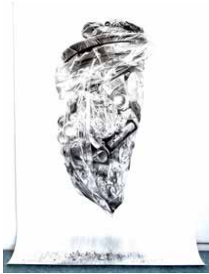
Violaine Desportes, Les Vigies III , 2023, fusain sur papier, 150 x 200 cm

Les œuvres de Violaine Desportes ont déjà été présentées dans différentes institutions notamment (sélection) au Musées des Beaux-Arts de Tournai en Belgique (octobre 2022) pour le Prix artistique de la ville de Tournai, au Centre culturel La Condition Publique à Roubaix pour l'exposition collective Plurielles dans le cadre de l'événement Urbaines (mars-juillet 2022), ou encore au Château de Noirmoutier pour l'exposition Fantastiques fond marins (avril-novembre 2021).