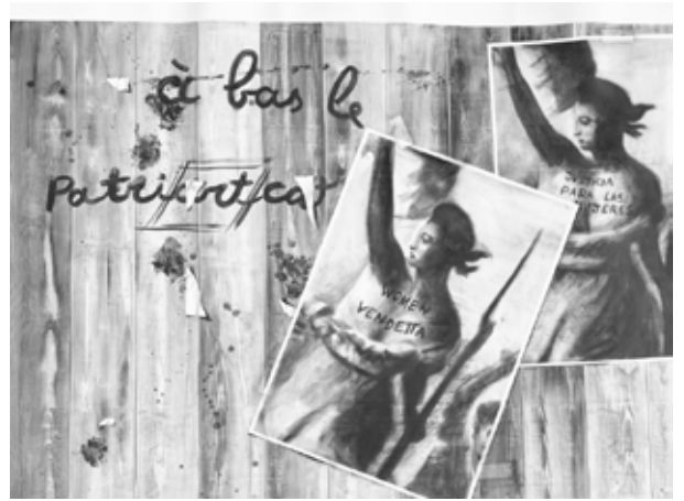
Jean-Philippe Roubaud, Barricade V (détail) , 2024, graphite sur papier, 134 x 900 cm