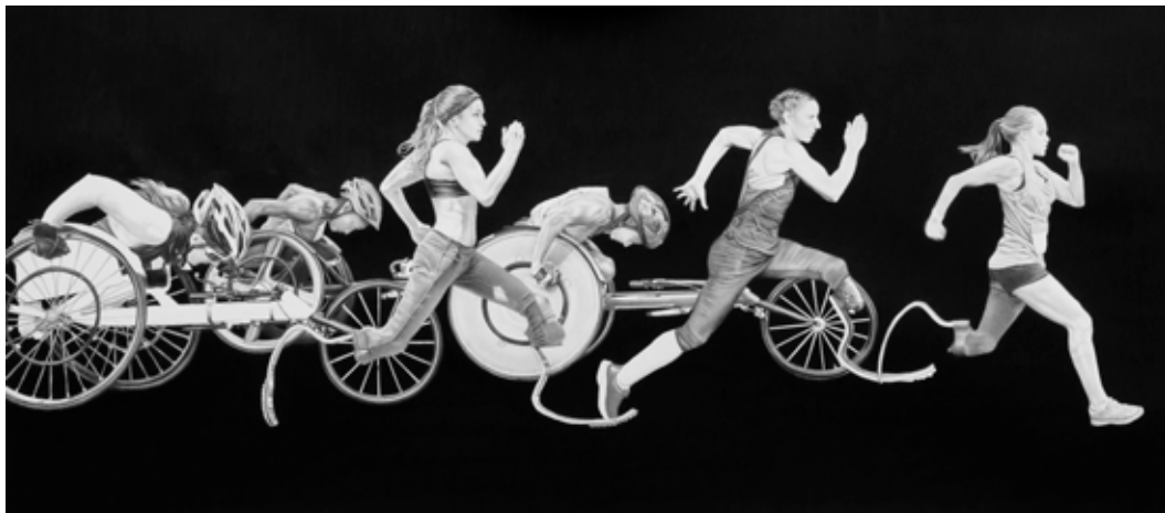
Maryline Terrier, Amazones paralympiques II , 2024, crayon graphite sur papier, 40 x 90 cm, encadrée : 50 x 100 cm