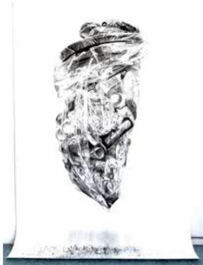
Violaine Desportes, Les Vigies III , 2023, fusain sur papier, 150 x 200 cm

Les œuvres de Violaine Desportes ont déjà été présentées dans différentes institutions notamment (sélection) au Musées des Beaux-Arts de Tournai en Belgique (octobre 2022) pour le Prix artistique de la ville de Tournai, au Centre culturel La Condition Publique à Roubaix pour l'exposition collective Plurielles dans le cadre de l'événement Urbaines (mars-juillet 2022), ou encore au Château de Noirmoutier pour l'exposition Fantastiques fond marins (avril-novembre 2021).