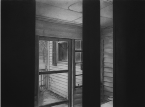
Reuben Negrón, Sans Titre (Echoes III) , 2021, fusain sur papier monté sur aluminium, 56 x 76 cm