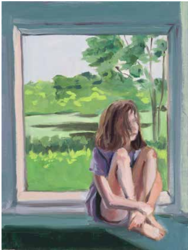
Noa Charuvi, Window Seat , 2024, huile sur lin, 30,5 x 22,9 cm, Courtesy H Gallery, Paris