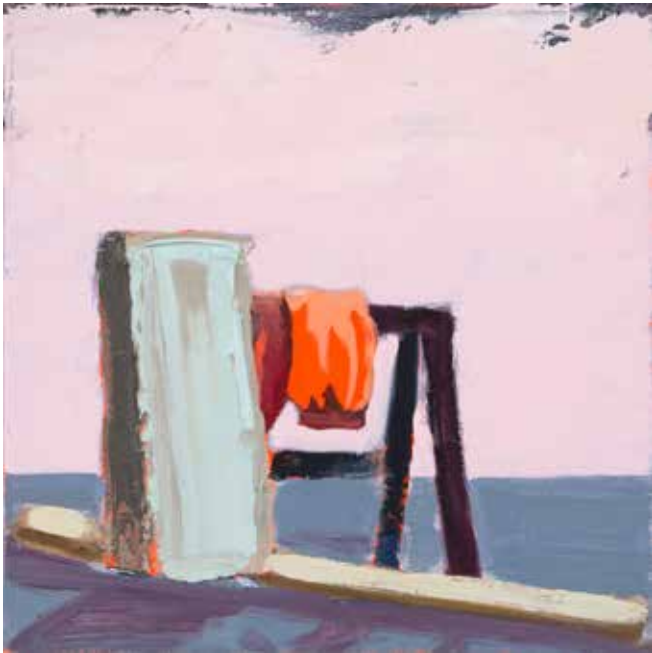
Noa Charuvi, Two By Four , 2024, huile et acrylique sur toile, 30,5 x 30,5 cm