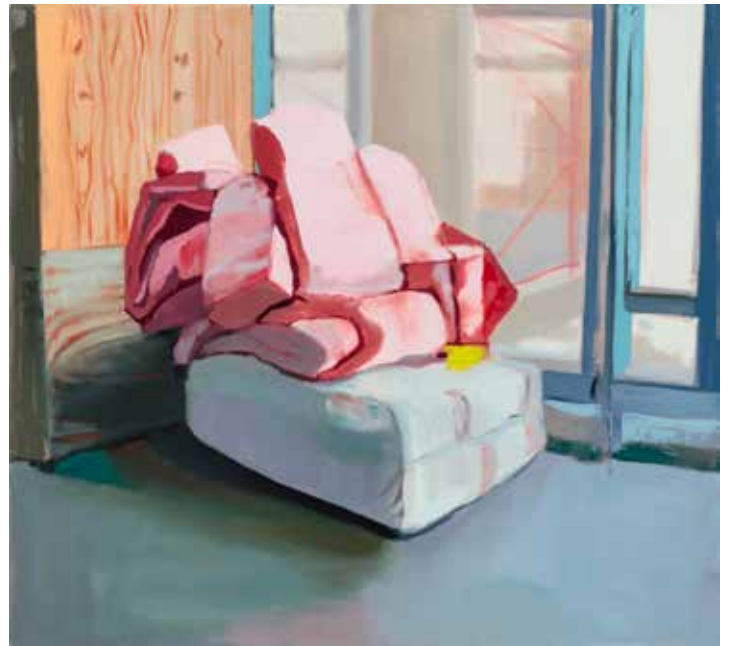
Noa Charuvi, Cotton Candy , 2016, huile sur toile, 76,2 x 83,8 cm