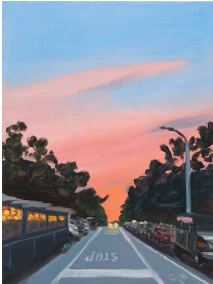
Noa Charuvi, Fort Green , 2024, huile sur lin, 30,5 x 22,9 cm