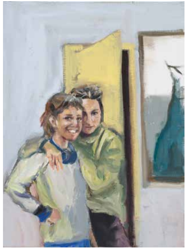
Noa Charuvi, Friends , 2024, huile sur lin, 30,5 x 22,9 cm