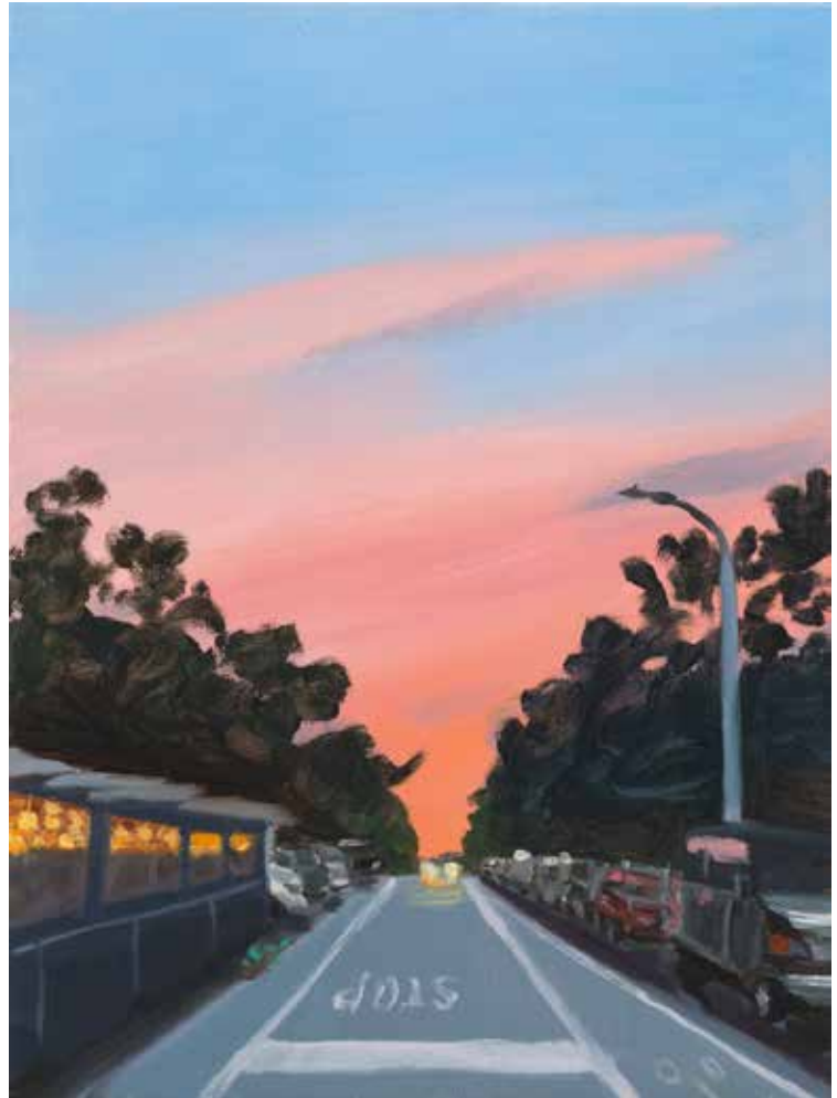
Noa Charuvi, Fort Green , 2024, huile sur lin, 30,5 x 22,9 cm