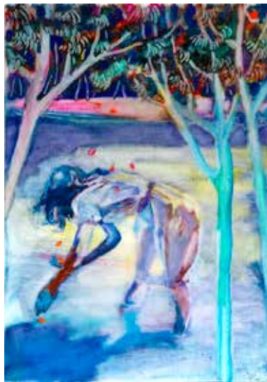
Sarah Jérôme, Revoir le ciel 24 , 2026, huile sur calque, 70 x 50 cm