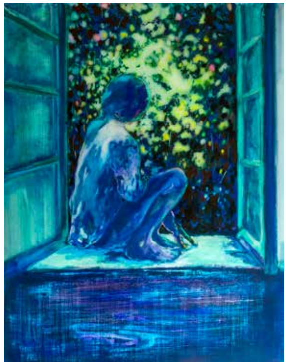
Sarah Jérôme, Revoir le ciel XX , 2026, huile sur papier calque monté sur Dibond, 152 x 120 cm, Courtesy H Gallery, Paris