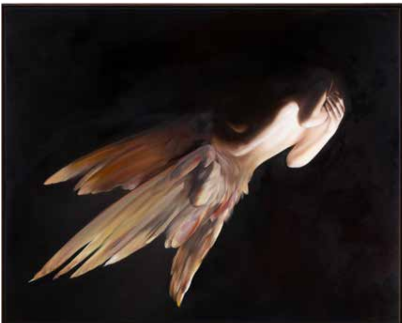
Oda Jaune, Les Deux , 2025, huile sur toile, 120 x 150 cm, Courtesy de l'Artiste et TEMPLON, Paris - Bruxelles - New York, ©EDELIN