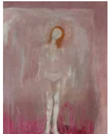
Louise Tilleke, Constance , 2021, technique mixte sur toile, 197 x 151 cm