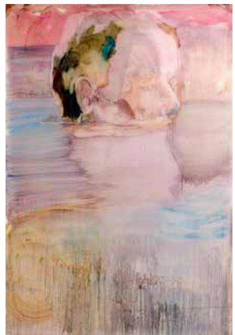
Sarah Jérôme, En eaux vives X , 2023, huile sur calque monté sur Dibond, 196,2 x 137,8 cm