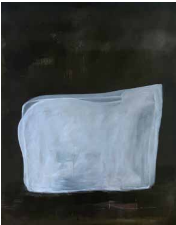
Louise Tilleke, L'Ours (Bloc de glace n°1) , 2024, technique mixte sur toile, 208 x 163 cm