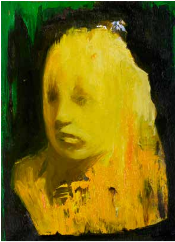
Karine Hoffman, Possessed , 2025, huile sur bois, 22 x 16 cm