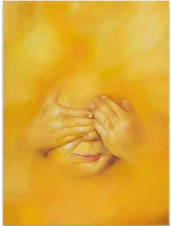
Oda Jaune, Midas Touch , 2025, huile sur toile, 40,5 x 30 cm