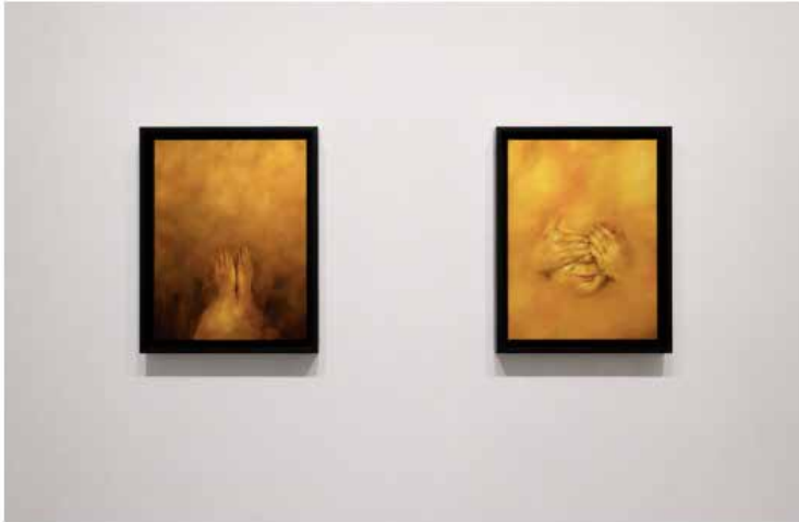
Vue de l'exposition Auprès du cœur sauvage , H Gallery, Paris. © Oda Jaune

Chez Oda Jaune, les corps émergent de la peinture, comme révélés de l'intérieur par une intense clarté. Rien n'est évident. Des visages se cachent, une nébuleuse engendre des mains, les ailes de deux anges fusionnent à l'instar de leurs corps déformés. La lumière attire autant qu'elle menace. Les territoires de Sarah Jérôme sont autrement incertains. Ses personnages étranges nous font basculer dans un onirisme crépusculaire. Assise sur le rebord d'une fenêtre, une jeune femme se captive pour une éruption magmatique de jaune dans le bleu profond de la nuit. Entre émerveillement et effacement, le regard hésite. L'ambiguïté se renouvelle plus loin, à l'orée d'un paysage aux couleurs acides, où un arbre au tronc vert émeraude pleure des feuilles orange sur un corps en pleine mutation. La beauté l'emporte alors sur l'effroi d'une possible tragédie.