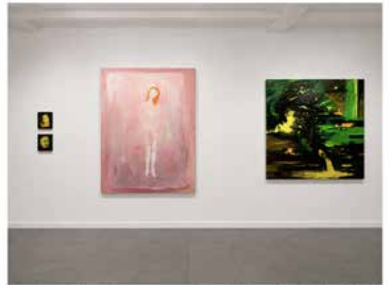
Vue de l'exposition Auprès du cœur sauvage , H Gallery, Paris. © Louise Tilleke et Karine Hoffman, photo MLD

Une même tension agit les œuvres de Karine Hoffman, peut-être les plus directement hantées par la mémoire. D'origine juive polonaise, l'artiste porte dans ses tableaux une histoire familiale marquée par les disparitions et les traumatismes de la Seconde Guerre mondiale. Mais rien n'y prend la forme du récit ou du témoignage. Des spectres habitent la peinture. Dans une danse cataclysmique de jaunes et de verts, deux mains cherchent à se rejoindre tandis que des visages fantomatiques surgissent dans le noir d'autres toiles. Traversés d'ombres et de résurrections, ces paysages mentaux conservent « la mémoire d'un drage », selon l'expression d'Olivier Kaepelin.