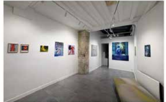
Vue de l'exposition Auprès du cœur sauvage, H Gallery, Paris. © Louise Tilleke, Karine Hoffman, Sarah Jérôme

La formule retenue pour l'exposition est légèrement différente. En effet, il ne s'agit plus d'être « près » mais « auprès ». Une nuance discrète qui en change pourtant profondément la portée. « Être près », c'est se situer, sans pour autant s'engager. Tandis qu'« être auprès », c'est avoir la possibilité de prendre soin du fragile, d'estomper l'inquiétant, de rêver l'insoupçonné, sans pour autant les réduire ou les maîtriser ; c'est respecter cette présence dont on ne sait ni la nature, ni les manifestations. Dans l'esprit du commissaire d'exposition, poète avant tout, il s'agit bien là d'une attitude, d'une forme de délicatesse.