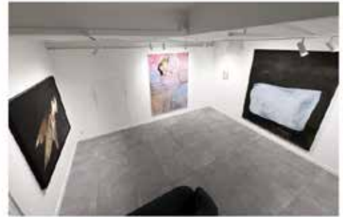
Vue de l'exposition Auprès du cœur sauvage , H Gallery, Paris. © Oda Jaune, Sarah Jérôme et Louise Tilleke, photo MLD

La peinture de Louise Tilleke n'agit pas différemment. Ses figures sont prises dans la matière qui les efface autant qu'elle les fait naître. Une adolescente s'extirpe de la couleur comme elle le ferait de l'enfance. A moins que l'œil ne se trompe et que, toute entière, elle n'en soit submergée. Ailleurs, d'un noir hésitant surgit une forme blanche. Qu'est-ce donc que cette étrangeté ? Peu à peu, se dessine dans la masse un corps..., celui d'un ours. Le voilà pris au piège de la glace, vestige d'une banquise disparue sous le sombre effet d'un certain réchauffement. Sarcophage de glace ou froid fragment de mémoire ? L'engagement pictural est indissociable de la destinée des êtres.