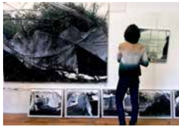
Paul Vergier - en haut à gauche - Le grand buisson - acrylique et pastel sur papier marouflé - 150x200 cm

Par une belle matinée d'automne, sous cette lumière si particulière de la Provence, je suis allée à la rencontre de l'artiste français Paul Vergier dans son atelier proche du village de Grignan. Ses représentations de serres maraichères me fascinaient depuis longtemps.