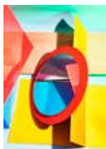
Eva Roovers, Moving Moments In Time 3, 2017