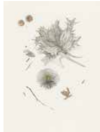
Mélanie Delattre-Vogt, Parlez-moi de votre panthère, 2017 ©Progress Gallery

Par la précision et la légèreté du graphite, l'artiste de 34 ans Mélanie Delattre-Vogt dessine des histoires poétiques, racontées par des objets en apesanteur. Enfin, le céramiste Antoine Tarot (1977) modèle le grès et tisse des formes compactes très colorées. La matière brute se meut en entrelacs, boudins, tresses et alvéoles, en un enchevêtrement maîtrisé fascinant.