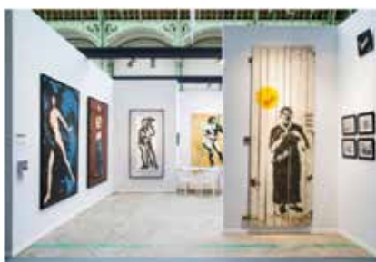
Galerie Ange Basso

Pionnier français de l'art urbain des années 1980, Blek le Rat (né en 1951) fait l'objet d'un solo show avec ses pochoirs créatifs, qui réinterprètent des sculptures et tableaux iconiques du Louvre. En véritable passeur, l'artiste cherche à faire sortir l'art du musée en convoquant des chefs-d'œuvre : la Joconde, la Vénus de Milo, le David de Michel-Ange ou la peinture de Caravage... Clou du stand : une palissade dénichée sur le chantier des grands travaux du Louvre, en 1984, flanquée d'une femme grecque.