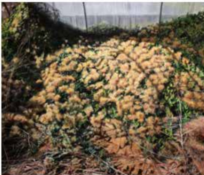
"Invasive 4", 2024 de Paul VERGIER

Sep Publié par Eric SIMON - Catégories : #Expo Peinture Contemporaine