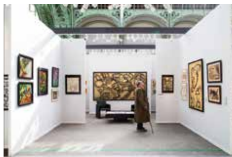
Galerie Michel Descours

Lorsqu'en 2013, la galerie Michel Descours a entamé une collaboration avec la famille de l'artiste d'origine belge Jean Raine (1927–1986), c'était pour mieux faire connaître sa peinture et la situer avec plus de justesse, depuis ses ancrages au sein du groupe Cobra jusqu'au déploiement d'une œuvre personnelle abstraite expressionniste. Dans cette optique, la galerie consacre un stand entier à cette figure artistique singulière des années 1960–1970 qui mérite d'être redécouverte et réévaluée.