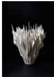
Yuki Nara, Bone Flower, 2017

Ouverte depuis quelques mois et dédiée à l'art contemporain japonais, la Pierre-Yves Caër Gallery propose deux artistes venus du pays du Soleil Levant. « J'ai choisi de représenter des artistes japonais (ou des artistes d'autres nationalités mais dont les œuvres sont inspirées par la culture japonaise) après avoir eu la chance de vivre plus de cinq ans au Japon et y avoir découvert la qualité exceptionnelle et la variété du travail de ces artistes, aujourd'hui beaucoup moins représentés en Europe que leurs homologues chinois ou coréens » explique le galeriste. « En plus, le marché de l'art contemporain étant encore très étroit au Japon, il est très important de leur ouvrir des opportunités sur d'autres marchés afin qu'ils puissent vivre pleinement de leur talent. Enfin, je trouve que c'est important que les collectionneurs français, découvrent à travers le travail très varié de ces artistes, à chaque fois un tout petit peu de la culture japonaise, à la fois si riche de ses traditions artistiques (dont peuvent s'inspirer les artistes contemporains) et aussi si innovante. »