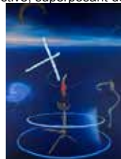
Wataru Yamakami, World of Worl, 2016

Le céramiste contemporain Yuki Nara étonne par son approche architecturale de la céramique, une double influence issue de ses études à l'Université d'Architecture de Tokyo et familiale car descendant d'une des plus grandes familles de céramistes du Japon, dont son père, Ohi Chozaemon XI, est aujourd'hui le grand maître et auquel il succédera dans quelques décennies. L'élégance de ces sculptures est exceptionnelle. Son compatriote Wataru Yamakami, né en 1981, est un artiste multidisciplinaire, marqué par les catastrophes qui ont marqué son pays. Il crée une oeuvre entre mirage et réalité. Dans un univers limpide, des symboles flottent, chacun chargé de sens, de signification et de perspective, superposant deux cosmos dans lequel évolue l'individu.