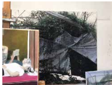
vue de l'atelier de Paul Vergier

Un jour, analyse-t-il rétrospectivement, il lui faut se défaire de l'horizon.