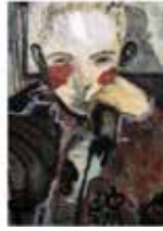
Guglielmo Castelli, Le ore fatte di nulla, 2018