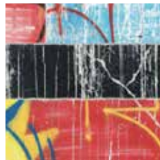
TILT, Plaquo Outside 20

Certaines galeries présentent trois artistes, d'autres se focalisent sur un solo show. C'est le cas avec les galeries suivantes. Venue de Moscou, la K35 Art Gallery présente Ilya Gaponov. Né en Sibérie en 1981, le peintre représente des paysages inspirés de la région de Kemerovo, une région pratiquement dédiée aux mines de charbon. Le matériau contamine la terre, en permanence noire, ce qui explique la sombreur de ses tableaux, peints à la laque de Kouzbass, un produit propre au traitement du charbon.