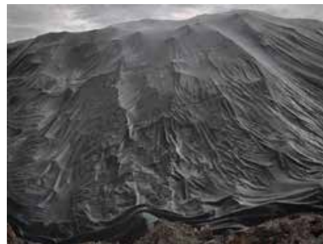
Paul Vergier - Black mountain, 150x200 cm, pastel, 2019

Adolescent, il arpente, sur sa mobylette cette fois, chevalet en bandoulière, les chemins autour de l'exploitation agricole familiale pour peindre sur le motif. Il se bricole des toiles sur châssis avec des tasseaux de bois et des draps.