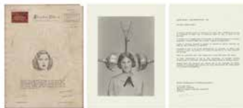
Maite Ibarreche, Dsvelamiento ©La Balsa Arte