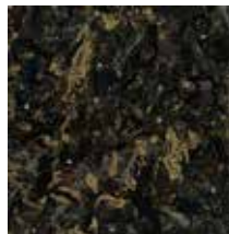
Steve Sabella, No Man's Land 2