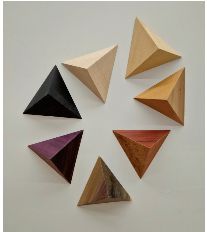
Emma Picard, Xylopyramides Chroma , 2026, bois naturels, dimensions variables, Courtesy H Gallery, Paris