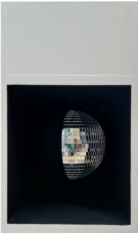
Emma Picard, Éclipse de fête 1 , 2026, boule à facettes argent, Musou Black paint, bois, diamètre 20 cm, 50 x 30 x 30,5 cm, Courtesy H Gallery, Paris