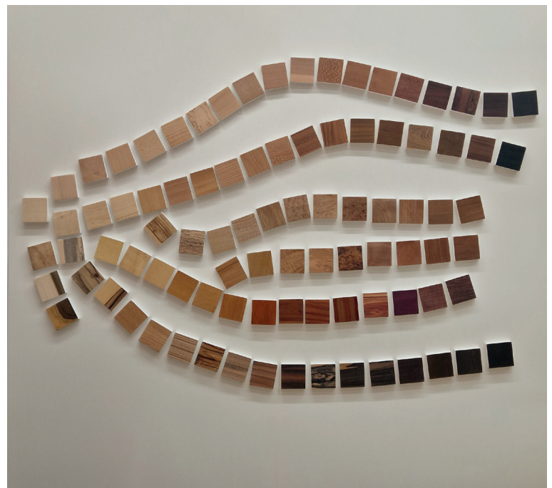
Emma Picard, Wixels , 2026, bois naturels, acrylique, 200 x 200 cm, dimensions variables