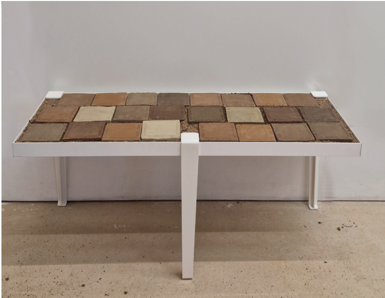
Emma Picard, Ban(c) Bourguignon , 2026, terres de vignes, métal laqué, 92 x 33 x 45 cm, Courtesy H Gallery, Paris