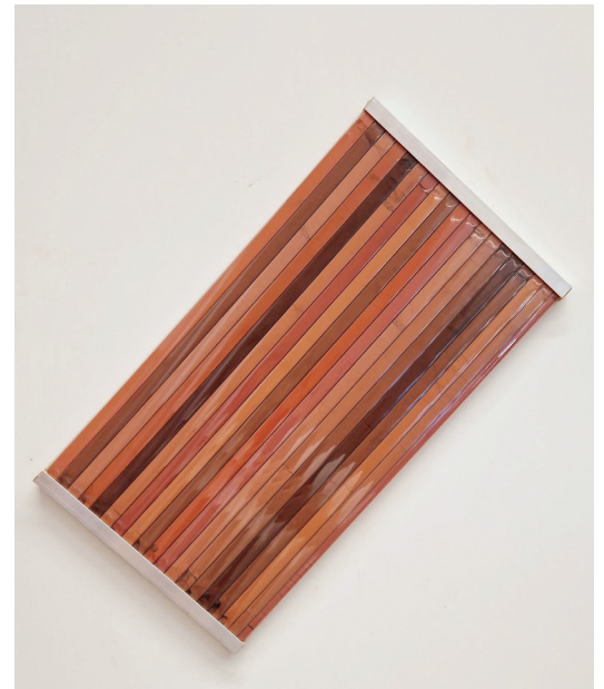
Emma Picard, Terres naturelles Ocres rouge , terres polycarbonate, aluminium, aimants, 30 x 29 x 1 cm