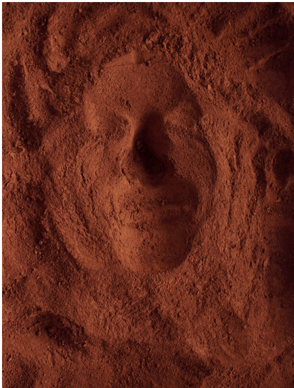
Emma Picard, Rouge de Venise , 2013, tirage sur papier Etching Mat, 80 x 60 cm

"Terres" pour ce qui nous fonde et nous lie à la Terre, "Arbres et Bois" comme notre présence corporelle, "Boules à facettes" enfin, pour représenter notre âme multiple, notre biodiversité humaine avec une touche d'humour et d'auto-dérision.