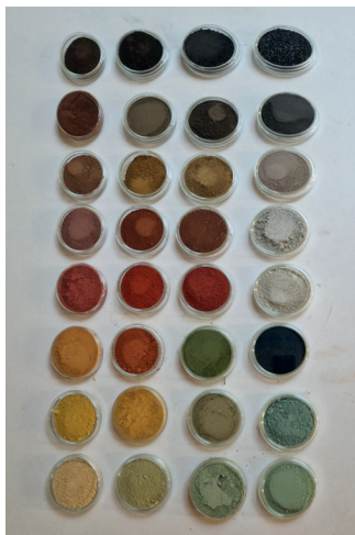
Emma Picard, Terres naturelles Inv. 1 , 2026, terres, boîtes de Pétri, dimensions variables

Les œuvres qui se répondent dans un foisonnement morcelé, pixellisé même, sont aussi une métonymie du fonctionnement en archipel du cerveau de l'artiste, où concision et éparpillement se donnent à voir en un seul regard et de manière non figée. Ainsi, le choix de présenter les pièces sur plaque